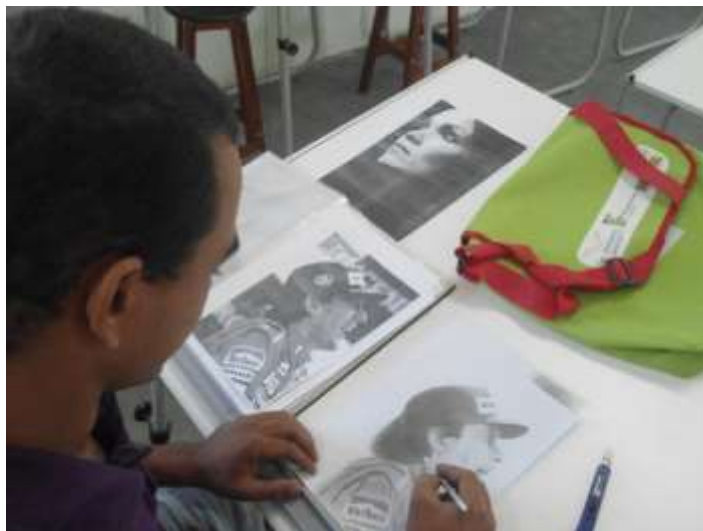
Figura 1 – Estudante finalizando um desenho com sombreamento