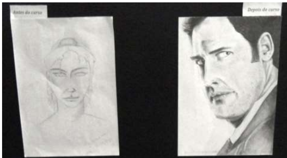
Figura 2 – Evolução do estudante do Curso de Desenho

O Curso de Desenho apresentou resultado muito satisfatório em relação ao desempenho dos estudantes que concluíram o Curso de Desenho, esses tiveram evoluções significativas em seus desenhos. Esta evolução pode ser percebida ao compararmos o desenho produzido no primeiro dia de aula com o desenho produzido no final do curso (Figura 2).