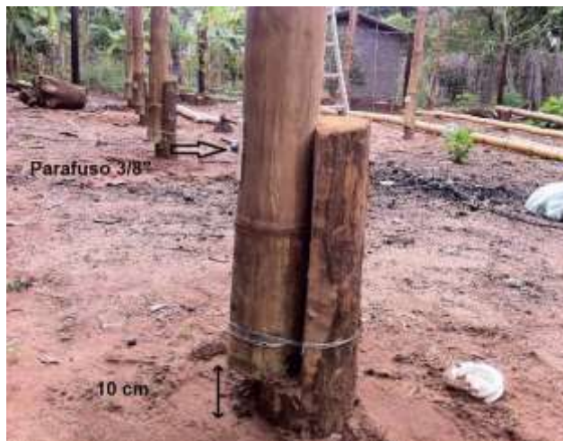
Figura 04. Detalhe dos mourões-de-espera

Sobre os mourões-de-espera, foram apoiados os pés-direitos constituídos de colmos de bambu com o comprimento de 2,5 m. Os pés-direitos foram fixados nos mourões com barras rosqueadas de 5/16", reforçando-se com arame galvanizado nº 18.