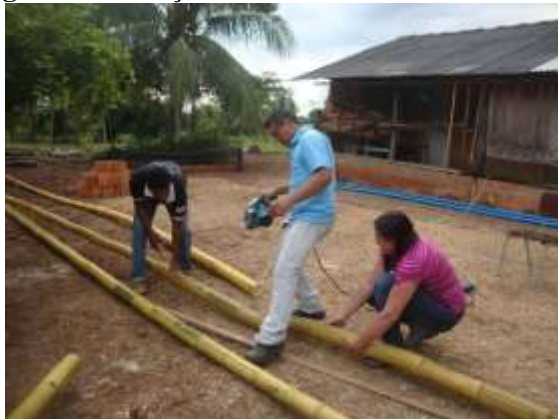
Figura 01. Seleção e corte dos colmos de bambu.

As peças menores (2 metros) receberam o tratamento químico, sendo que as mesmas foram colocadas em recipientes contendo 200 litros de calda à base de água, ácido bórico e sulfato de cobre, conforme já descrito, ficando imersas durante 15 dias (Figura 02).