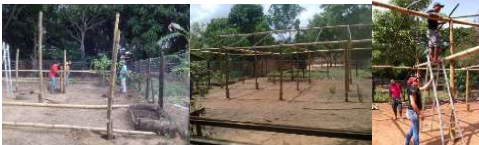
Figura 05. Etapas de construção da estufa

Ao final foi feito um comparativo dos custos do uso do bambu com a madeira para a construção de uma estufa. De acordo com os dados registrados para o corte, transporte e tratamento do bambu, o custo foi de aproximadamente R$ 160,00. Enquanto que que os custos para construção de uma estufa de madeira com o mesmo dimensionamento seria, em média de R$