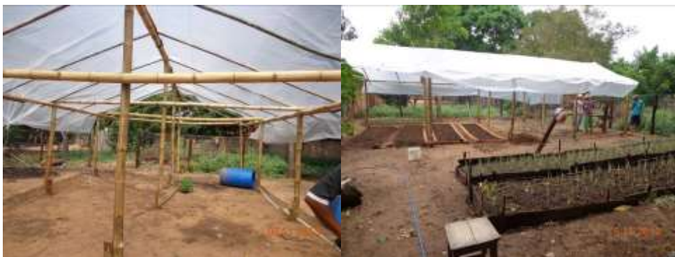
Figura 06. Estufa concluída e construção dos canteiros dentro da estrutura.

Na figura 06 mostra a estufa concluída com os canteiros prontos para a sementeira.