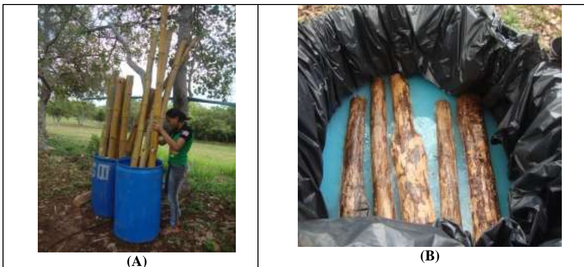
Figura 02. Tratamento químico com uma solução à base de sulfato de cobre e ácido bórico dos colmos de bambu (A) e das toras de madeiras utilizados como mourões-espera (B).

As peças maiores foram tratadas com fogo utilizando um lança chamas. Foram utilizados também peças de madeira de 1,2 m tratadas para servirem de mourões de espera dos pés-direitos e apoiar o bambu. O uso destas peças evita que os bambus tenham contato com a terra.