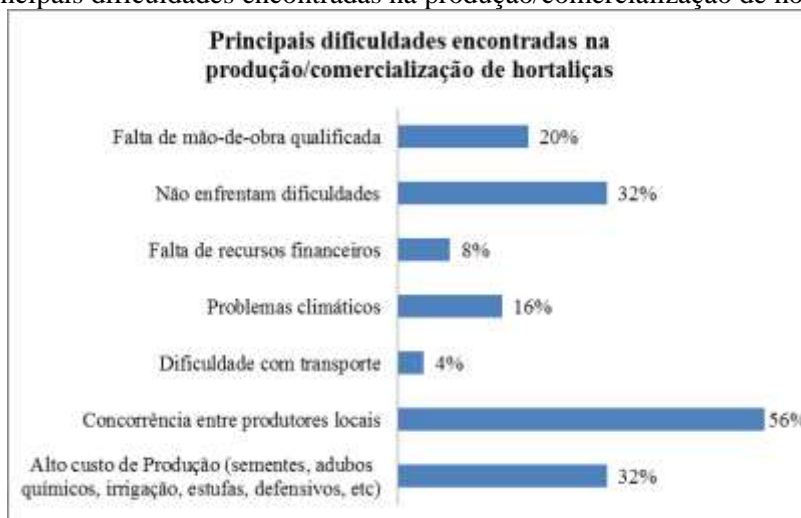
Figura 6 – Principais dificuldades encontradas na produção/comercialização de hortaliças

Apurou-se que 80% dos produtores entrevistados ainda não realizaram nenhum curso voltado ao cultivo de hortaliças, e os demais, 20% dos produtores, realizaram um curso voltado