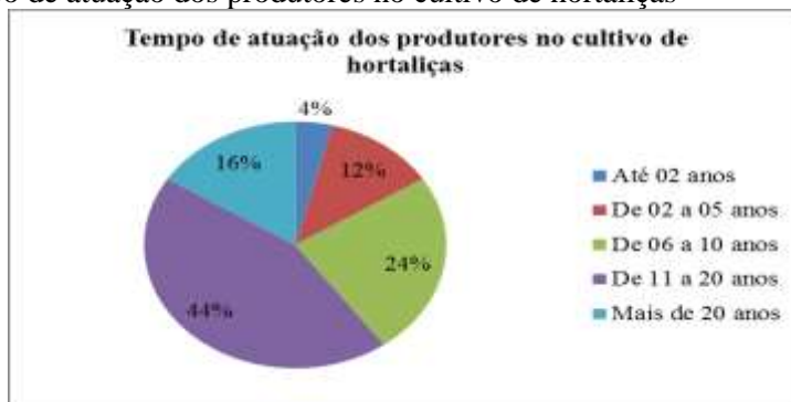
Figura 1 – Tempo de atuação dos produtores no cultivo de hortaliças

A tabela 1 exibe o número de integrantes da família (incluindo o produtor) que participam das atividades de produção e/ou comercialização de hortaliças no município de Porto Nacional. Identificou-se que 4% dos produtores não conta com a participação de nenhum membro da família para produzir/comercializar hortaliças, visto que conta apenas com 01 integrante, ou seja, ele mesmo, considerando que a pesquisa inclui a participação do próprio produtor. Por conseguinte, 12% dos produtores contam com 02 integrantes da família, 24% com 03 pessoas, 44%, maior percentual, com 04 membros e 16% dos produtores contam com a contribuição de 05 ou mais pessoas da família. Por outro, quando, indagado aos produtores se os descendentes da família demonstram interesse em permanecerem na atividade, 64% dos produtores responderam que não e 36% afirmaram que sim.