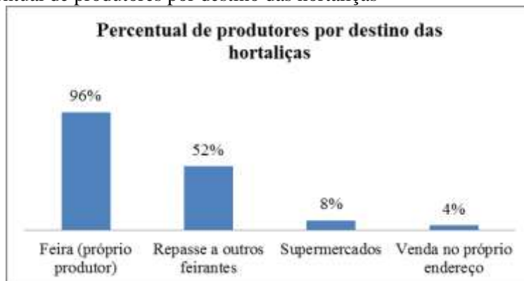
Figura 4 – Percentual de produtores por destino das hortaliças

Considerando a renda familiar mensal obtida pelos produtores com a produção/comercialização de hortaliças se obteve os seguintes dados, 48% dos produtores possuem renda entre 02 a 03 salários mínimos, 24% entre 03 a 04 salários, 16% entre 04 a 05 salários, 8% entre 01 a 02 salários e, por fim, 4% optaram por não responder ao questionamento (tabela 2).