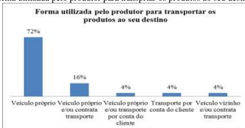
Figura 5 – Forma utilizada pelo produtor para transportar os produtos ao seu destino

Foram levantadas as principais dificuldades encontradas na produção e comercialização de hortaliças (figura 6). A maior parte dos produtores, 56% deles afirmou que a principal dificuldade é a concorrência acirrada entre os produtores locais; 32% mencionaram que o grande problema é o alto custo de produção (sementes, adubos químicos, irrigação, estufas, defensivos, etc); 20% relatou a falta de mão-de-obra qualificada; 16% apontou os problemas climáticos; 8% afirmou ter dificuldades para obtenção de recursos financeiros; 4% apontam dificuldade com transporte; e por fim, 32% um número considerável não apresentam dificuldades (nesta pergunta o produtor poderiam escolher mais de uma alternativa).