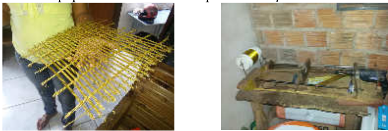
Figura 03 – Varinha e equipamento desenvolvido para fabricação da varinha