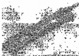
Figura 04 - Máquina de enrolar linha em haste de capim dourado