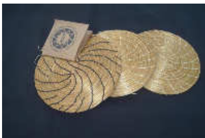
Figura 02 – Produto com etiqueta ACDP

As peças vendidas pela associação possuem uma etiqueta de identificação da ACDP, como demonstrado na foto abaixo. Com relação ao nível de qualidade das peças a associação realiza um controle bastante simples, a presidente disse que quando os associados disponibilizam as peças na loja, ela mesma ou quem estiver atendendo, analisa a qualidade menciona o que precisa ser melhorado, como por exemplo, o forro ou a costura e sugere modificações. A presidente informou ainda, que antes a associação tinha um controle de qualidade, agora se encontra desativado. No entanto, não soube explicar como funcionava.