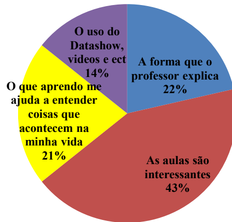
Figura 2. Motivos que levam os estudantes a gostar de Ciências

conseguem perceber a relação existente entre os temas trabalhados em sala e a vida cotidiana, além de mostrar a influência da maneira com que o docente aborda os conteúdos. No entanto, foi constatado que as aulas não são muito diferenciadas (aulas práticas, uso de jogos, materiais alternativos), isso gera desatenção por parte da maioria dos estudantes. É inegável a necessidade de realizar aulas diferenciadas, pois os estudantes estão acostumados a um mundo dinâmico e atraente, a mídia os bombardeiam com informações rápidas, os jogos de última geração prendem a atenção o que dificulta muito o interesse em aulas com padrão tradicional.