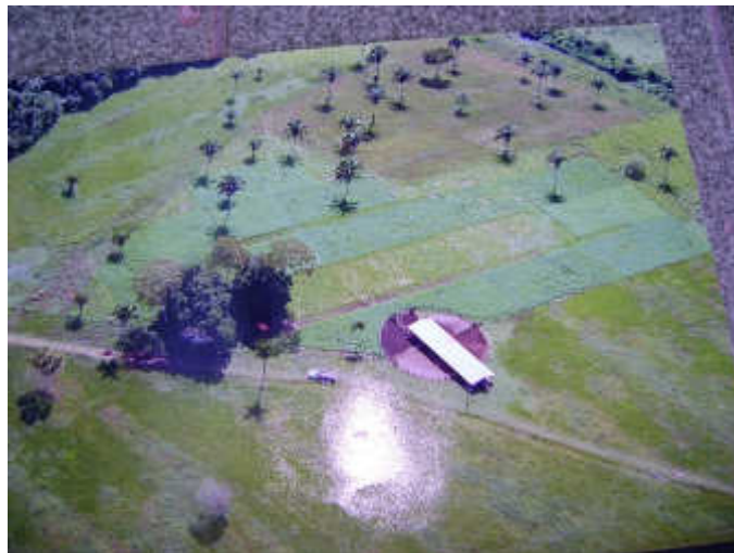
Figura 1: Imagem de satélite das instalações do Projeto Balde Cheio.

O levantamento de dados para compor o presente trabalho foi realizado em junho de 2015 no Setor ZOO III (Projeto Balde Cheio) do Instituto Federal de Educação, Ciência e Tecnologia do Tocantins - Campus Araguatins, nas coordenadas geográficas aproximadas de 05° 38' 35" Sul e 48° 04' 14" Oeste, com altitude 103 m. Segundo a classificação de Köppen o clima da região é tropical alternadamente úmido e seco com temperatura média anual de 27°C e umidade média anual de 85% (INMET, 2015).