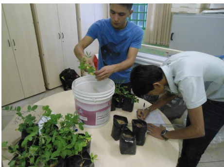
Imagem 5 – Aferição do tamanho e pesagem das raízes e parte aérea.