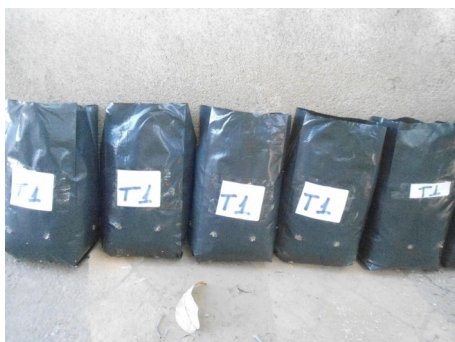
Imagem 1 – Plantio de Arachis spp. em sacos plásticos

Ao término do experimento, as plantas foram retiradas dos sacos plásticos, realizou-se a aferição do tamanho e pesagem da raiz, parte aérea, respectivamente (Imagem 5). Logo, foram colocados em estufa de secagem à 65°C durante três dias. Quando o ciclo de secagem foi completado, realizou-se a pesagem, separadamente, das raízes e da parte aérea (Imagem 6).