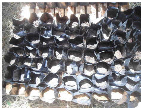
Imagem 2 – Plantio realizado pelos estudantes.