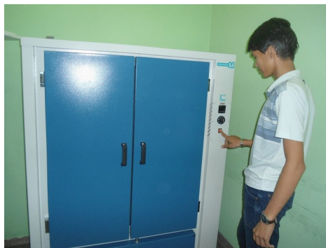
Imagem 6 – Estufa de secagem à 65°C.