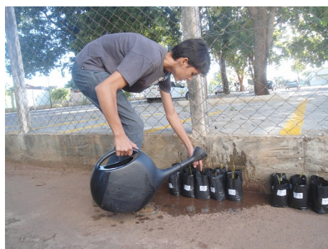
Imagem 4 – Irrigação diária com regador.