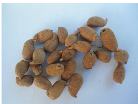
Imagem 3 – Sementes de Arachis spp.