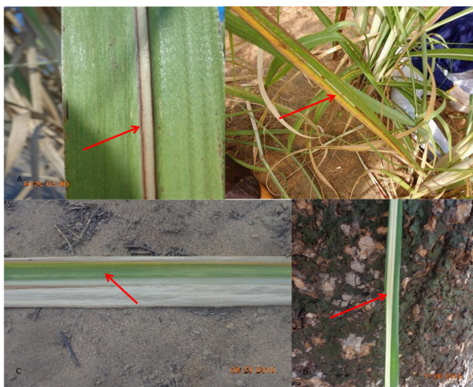
Figura 1. Sintomas de Xanthomonas sp.; Puccinia sp. e Acidovorax sp. em plantas de cultivares de cana-de-açúcar ( Saccharum spp.). A. Folha com nervura atacada com setas indicando estrias; B. folha com sintoma de ferrugem; C. Folha com sintoma latente de escaldadura e D. folha com sintoma crônico de escaldadura. Pedro Afonso - TO, IFTO/Campus Avançado Pedro Afonso, 2016.

As análises de variância de incidência das doenças estria vermelha, escaldadura e ferrugem alaranjada das folhas não foi observada interação entre as doenças e os tratamentos. Havendo efeito significativo a 1% pelo teste F para doenças, não sendo observado efeito significativo entre as cultivares (Tabela 1).