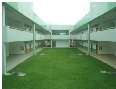
Figura 2 – Blocos de sala de aula analisados.