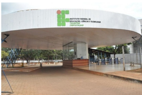
Figura 1 – Acesso Principal do Campus Palmas.

Para definir a metodologia de coleta de dados a ser aplicada no Campus foi realizado levantamento bibliográfico no intuito de perceber como pesquisas em diferentes instituições de ensino procederam. Foi estabelecido então ambientes dispostos em um percurso, que hipoteticamente seria percorrido por um portador de necessidades especiais/mobilidade reduzida. Foi delimitado como área de estudo as rotas e deslocamentos entre a biblioteca e os blocos de sala de aula (figuras 1 a 4).