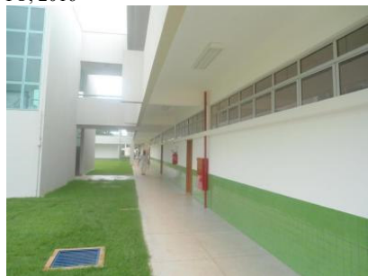
Figura 3 – corredor do Bloco de sala de aula analisado.