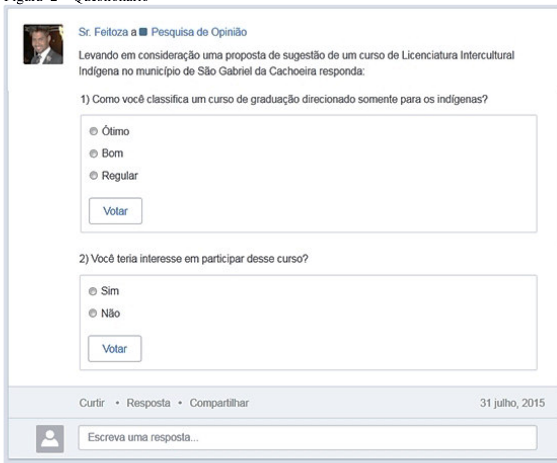
Figura 2 – Questionário

A figura 2 mostra o questionário por completo em branco, conforme disponível na plataforma do EDMODO. Neste questionário foram abordadas questões simples, porém diretas em relação ao estudo realizado. Na primeira questão, o entrevistado classifica sua visão em relação a uma proposta de curso de Licenciatura Intercultural direcionado somente ao público indígena, conforme pode ser observado, os níveis são classificados em ÓTIMO, BOM e REGULAR. E, na segunda questão, o estudante é abordado quanto ao seu interesse em participar desse curso, dispondo de apenas duas alternativas SIM ou NÃO.