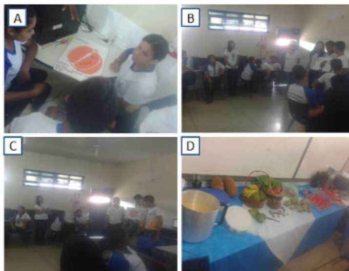
Figura 3: A - Alunos construindo modelos didáticos; B e C - alunos apresentando os modelos com a classificação feita; D - Produtos vendidos na minifeira.

As atividades idealizadas no presente estudo ocorreram de forma dinâmica, sendo que os alunos demonstraram-se participativos durante todas as etapas de sua realização (Figura 03).