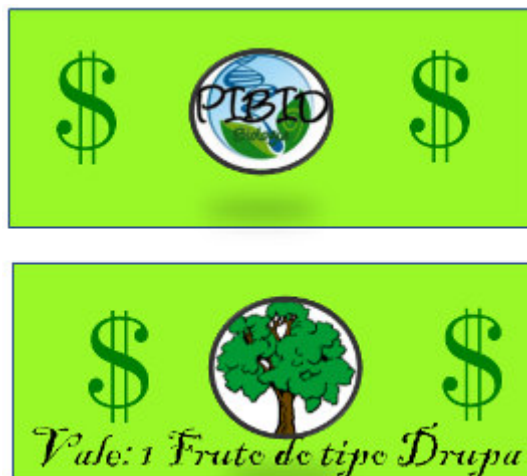
Figura 2: Cédula utilizada para a compra na feira

Aos grupos, de acordo com o desempenho, foram repassadas cédulas (Figura 2), que representavam dinheiro, e seriam utilizadas para a próxima etapa da ação: a feira comercial. Nesta, haviam frutos e produtos feito com estes, que os alunos poderiam comprar com as cédulas repassadas. No entanto, em cada cédula no lugar de valor, havia um tipo de fruto. Assim, o aluno deveria saber o tipo de fruto para poder realizar a compra.