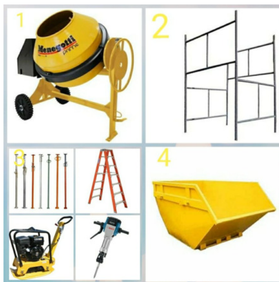
Imagem 1 – Equipamentos encontrados – 1-Betoneira 2-Andaimes 3-Outros equipamentos e 4-Caçamba

Com o princípio da pesquisa se fez observado que o setor de aluguel varia muito de acordo com o setor/ramo, se diferenciando principalmente de acordo com as máquinas e equipamentos de alugueis, onde algumas empresas optaram por atender somente um tipo demanda, como as empresas “tira-entulho” que em sua totalidade verificada pela pesquisa, só atendem a essa demanda. Outro ponto levantado durante o período dedicado a desenvolver esta base de dados foi as dificuldades que as empresas encontram nesse setor, assim obtivemos uma tabela dos resultados demonstrada a seguir: