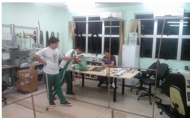
Figura 1 - Montagem do viveiro no Laboratório de Física do Campus Araguaína - IFTO

Inicialmente, a preparação e montagem do modelo planejado ocorreu no laboratório de Física do Campus Araguaína do Instituto Federal de Educação, Ciência e Tecnologia do Tocantins IFTO (Figura 1).