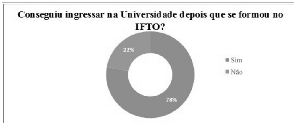
Figura 05: ingresso na Universidade depois que os alunos se formaram no IFTO

A figura 5 aponta que o número de alunos egressos do curso Técnico em Informática que conseguiram ingressar em uma Universidade, é bem significativo, que mesmo com a formação técnica os alunos optaram em continuar com os estudos, seguindo no ramo da informática e ingressaram no curso de Licenciatura em Computação no próprio IFTO.