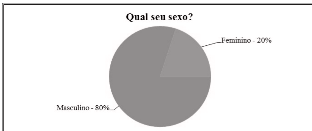
Figura 01: Gênero

A figura 1 aponta que o número de mulheres matriculadas e concluintes foi bem abaixo do que o número de homens. Observa-se que a participação da mulher no curso técnico em informática é apenas de 20%, bem a baixo considerando a participação masculina que é de 80%. De acordo com as alunas, uns dos fatores limitantes para a conclusão do curso está na dificuldade para conciliar com o trabalho e com as atividades domésticas.