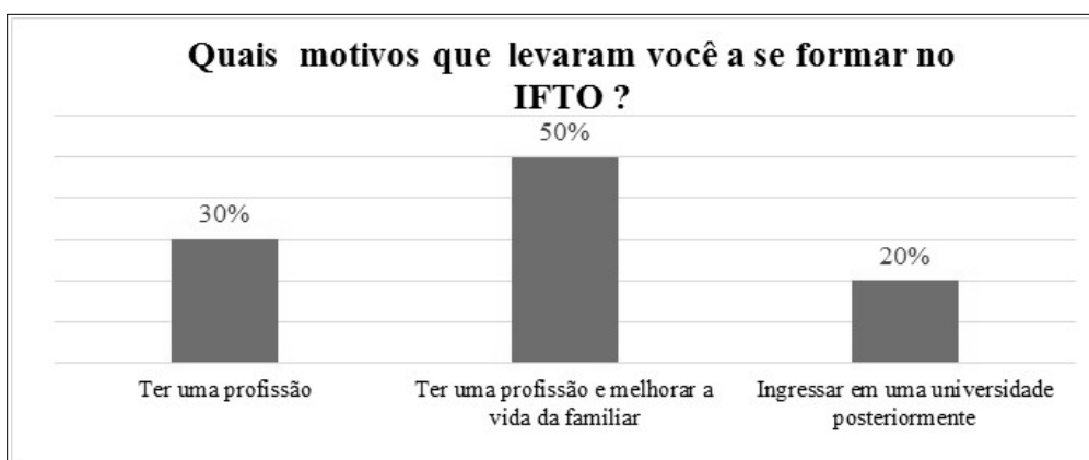
Figura 04: motivos que levaram os alunos a se formarem no IFTO

Identificou-se através da pesquisa que a decisão e a motivação dos alunos egressos por optarem a estudar no IFTO, deu-se pela oportunidade de ser uma Instituição Federal Pública e gratuita, com padrão de qualidade no Ensino Técnico, superior às outras Instituições Privadas e de