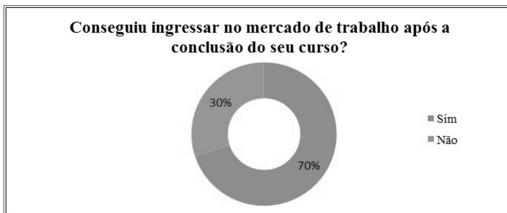
Figura 05: ingresso no mercado de trabalho após a conclusão do curso técnico no IFTO

De acordo com os alunos egressos, de fato o que dificulta a inserção no mercado de trabalho é a pouca oferta de estágios em empresas da região, a falta de convênios e/ou parcerias com as empresas locais, já que as mesmas preferem por optar por pessoas já capacitadas, com conhecimento e experiência técnica. Ainda segundo o relato de alguns alunos egressos, a proposta do referido curso, visa o trabalho autônomo e não a preparação para as possíveis vagas oferecidas em algumas empresas. Como mostra o gráfico acima 70% dos alunos após concluírem o curso de Técnico em Informática conseguiram ser inseridos no mercado de trabalho, desse percentual boa parte está empregado em alguma empresa local como assalariado e a outra parte trabalha como autônomos.