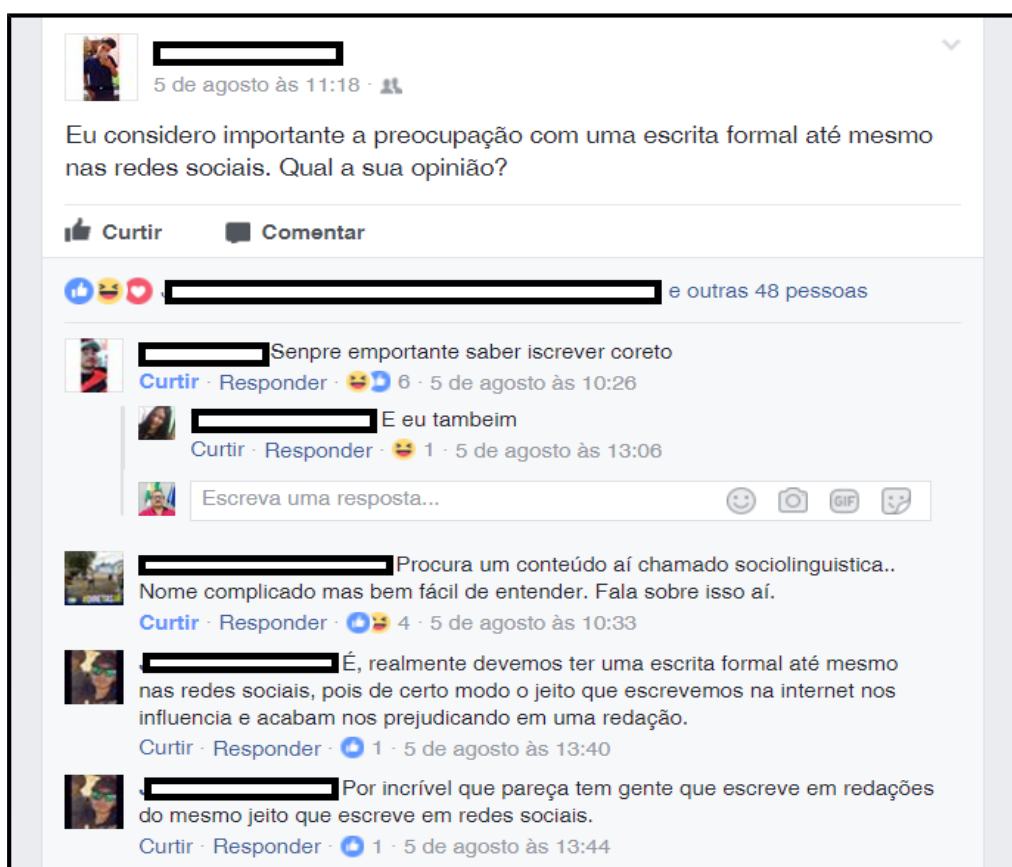
Figura 1 – Postagem motivadora da língua padrão nas redes sociais

Nesta perspectiva, o presente estudo demonstra na Figura 1, uma postagem cuja motivação era a demonstração de que a linguagem padrão deve ser seguida até mesmo nas redes sociais, e ao mesmo tempo fomentando a discussão ao perguntar a opinião dos usuários: