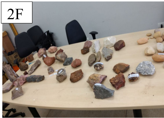
Figura 2 – Representação das rochas, minerais e madeiras petrificada.