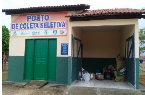
Figura 4 – Amostra meses dez/16 e Jan/17

Entretanto, a partir do mês de novembro, notou-se o aumento da adesão da população ao projeto, diariamente o posto recebia uma média de material, semelhante à Figura 4. Percebeu-se que todos os esforços para divulgação do Posto de Coleta, por meio do carro de som, mídias sociais, bem como as chamadas do programa Momento Ambiental, na rádio Sucesso FM, tiveram um efeito extremamente bem positivo.