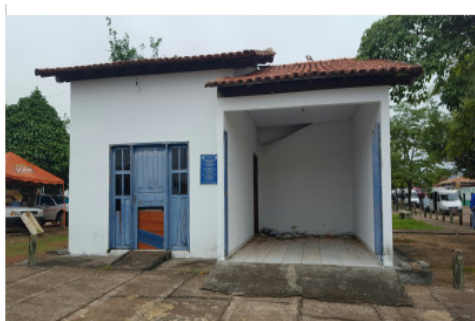
Figura 1 – Prédio da Polícia Militar