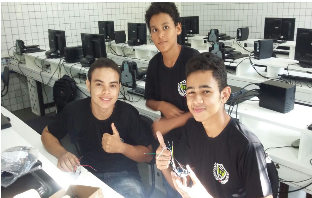
Figura 1 – Alunos do projeto durante aula prática