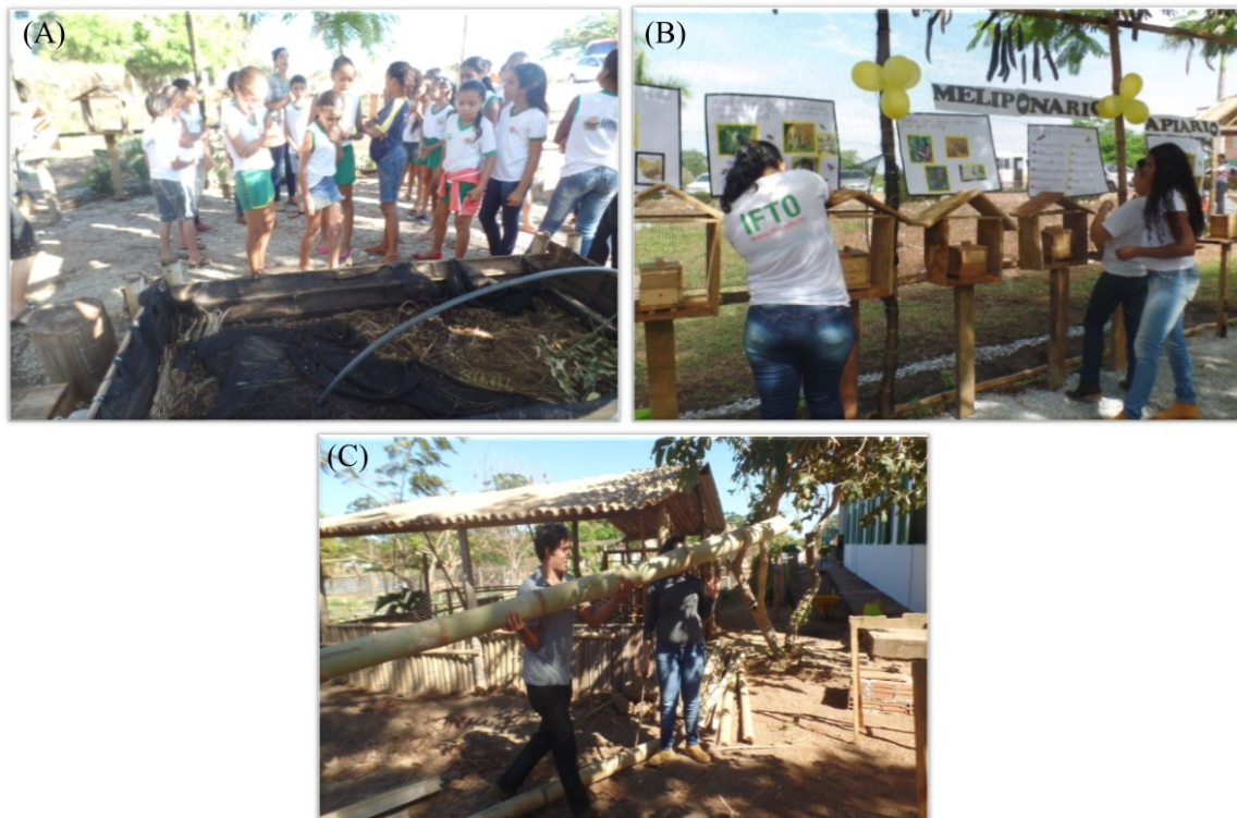
Figura 3: Setores de criação animal dentro do NEA; (A) Vermicompostagem (minhocário); (B) Meliponário e (C) Galinheiro em construção.

A estufa ecológica foi construída em bambu e a cobertura deu-se com sombrite e plástico transparente (SILVA et al.,2011), dentro da estufa também foi instalado sistema de irrigação e suporte para bandejas, utilizadas para a produção de mudas de espécies olerícolas que são transplantadas nos canteiros.