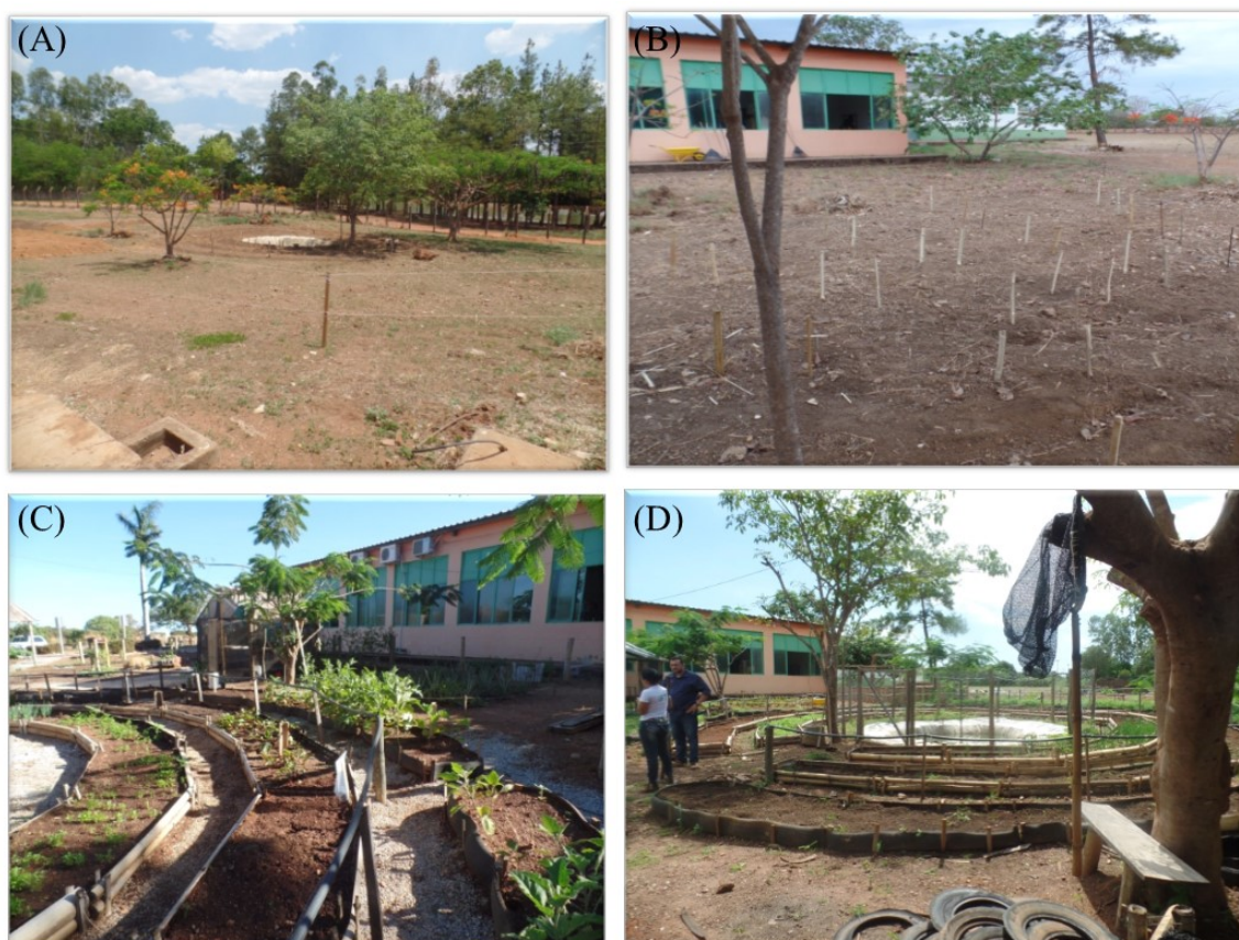
Figura 1: Evolução da implantação do Núcleo de Estudos em Agroecologia no Campus Avançado Formoso do Araguaia. (A) Demarcação dos limites do poço e entorno do projeto; (B) Piqueteamento da área dedicada à construção dos canteiros circulares; (C) Vista geral do projeto já implantado e canteiros em produção e (D) Vista geral dos canteiros com o sistema de irrigação e tanque de peixes.

apresentaram largura de 1 m e espaçamento de 0,5 m e foram preparados com terra preta, esterco de vaca e calcário. O sistema de irrigação adotado foi de microaspersão, no qual se instalou uma linha de irrigação no canteiro do centro e utilizou-se como fonte de água para a irrigação aquela proveniente de uma cisterna (Figura 1D), já previamente existente próxima ao local de instalação da horta.