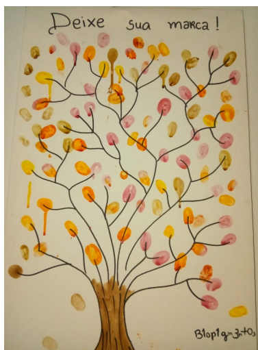
Figura 2: Quadro pintado por alunos na 1ª Amostra da semana do Biotecnólogo do campus Araguaína com as tintas produz.