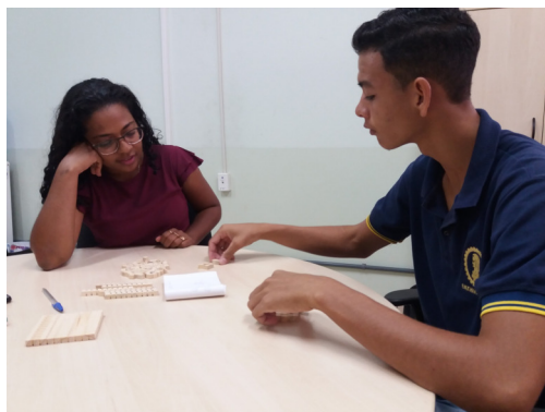
Foto 02 - Material Didático-Pedagógico confeccionado pela Intérpretes de Libras, para auxílio no aprendizado do aluno em relação ao Teorema de Pitágora.

Foto 01- Intérprete de Libras faz uso do Material Dourado, para ensinar conceitos e processo para efetuar cálculos básicos de natureza matemática utilizando divisão, subtração, multiplicação e soma.