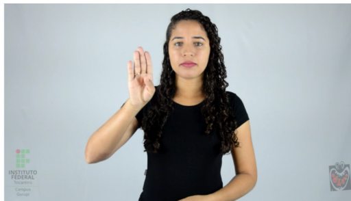
Foto 03- Aluno surdo realiza vídeo-prova em libras com auxílio do tablet.