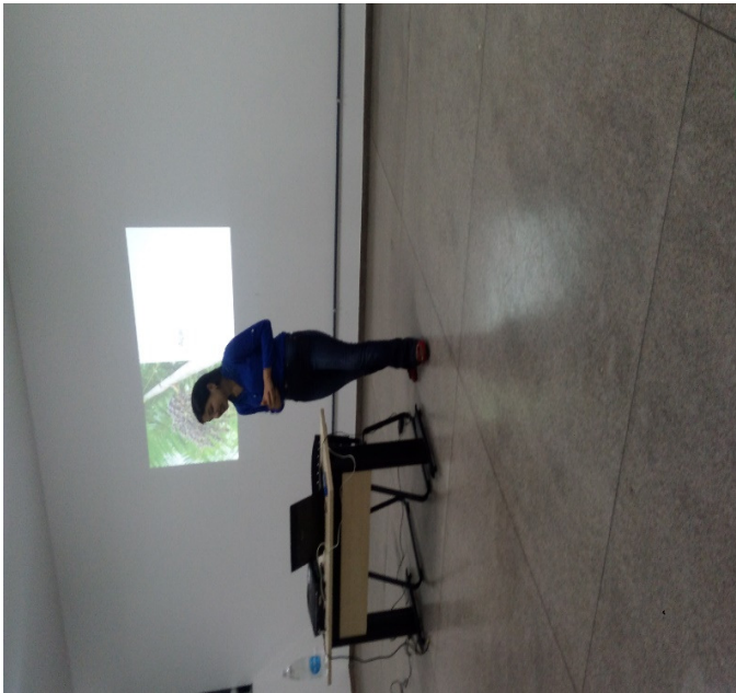
Figura. 2 Materiais utilizados para confecção Figura 1. Apresentação do conteúdo teórico