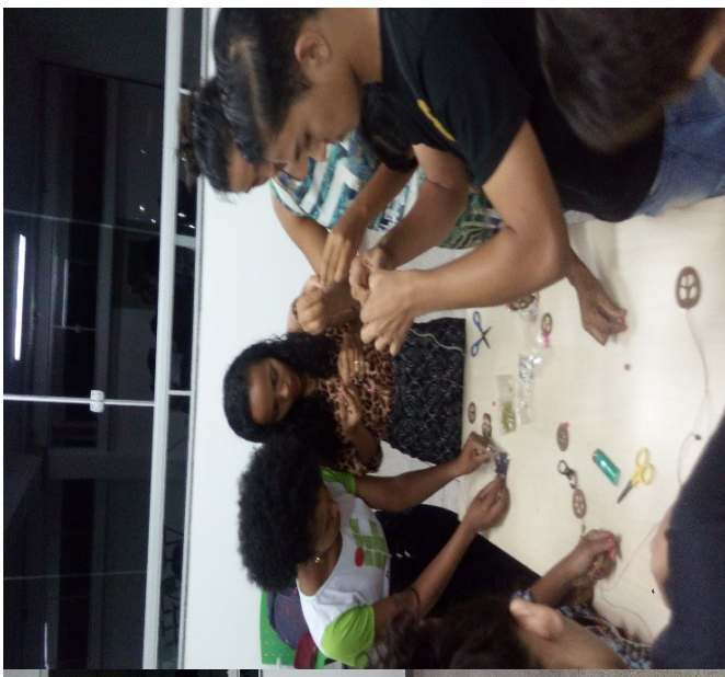
Figura 3. Jogo de perguntas e respostas

Na (Fig.3) está ilustrando o mento do jogo de perguntas e respostas, no qual cada participante teve a oportunidade de jogar o dado pelo menos duas vezes e responder duas perguntas. Já na (Fig.4) tem os participantes montando as peças artesanais.