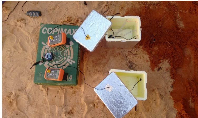
Figura 4. Materiais utilizados no experimento.

Um segundo experimento foi realizado no intuito de investigar a variação na temperatura da água devido ao aumento na agitação das partículas, provocado pela bomba de aquário ao fazer a água circular pelas mangueiras de borracha. Esta investigação foi registrada no intervalo de 25 minutos.