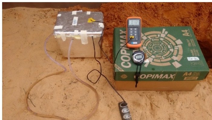
Figura 4. Materiais utilizados no segundo experimento.

A causa da escolha de um tempo menor de 25 minutos foi de que nessa etapa queríamos investigar apenas a ação da agitação das partículas, e não o efetivo aquecimento.