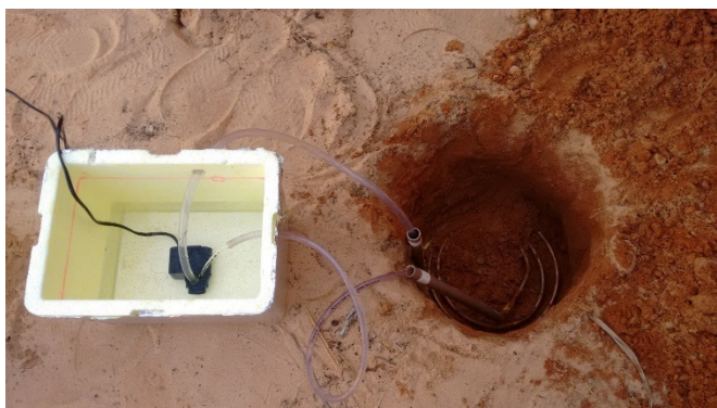
Figura 3. Registro da temperatura da superfície do solo a 30 cm de profundidade.

Como é demonstrado na Figura 3, a bomba de aquário foi instalada no interior da caixa de isopor. Além disso, podemos verificar na imagem os tubos de cobre, conectados a bomba de aquário através das mangueiras de borracha, posicionados a 30 cm de profundidade da superfície. Vale destacar que antes de enterra o tubo de cobre, inserimos as mangueiras de borracha dentro de tubos de PVC como o objetivo de evitar que a pressão da terra dificultasse a condução da água.