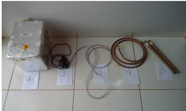
Figura 1. Materiais utilizados na construção da bomba de calor geotérmica. (1) Caixa de isopor recoberta com papel alumínio para reduzir as trocas entre a parte interna da caixa e o meio externo; (2) Bomba de aquário; (3) Mangueira de borracha transparente; (4) Tubo de cobre; (5) Canos PVC 20 mm.

Na etapa seguinte projetamos uma bomba de calor geotérmica, empregando na sua construção materiais de baixo custo e de fácil aquisição. Na Figura 1 são demonstrados todos os itens utilizados.