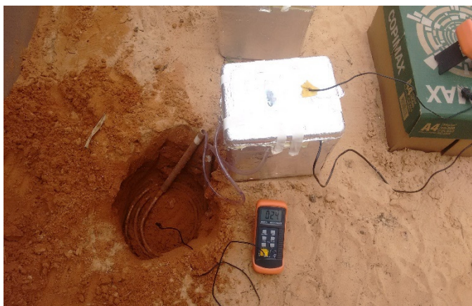
Figura 2. Registro da temperatura da superfície do solo a 30 cm de profundidade.