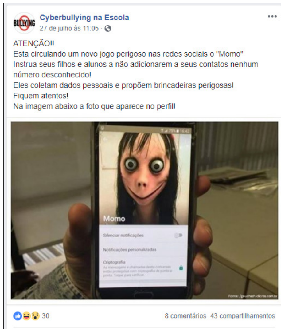
Figura 2 – Postagem com ocorrência de cyberbullying

À luz dos conceitos de Lévy (1999), outros pontos relevantes são demonstrados por meio da Figura 2, uma postagem cuja mote instigador aos usuários foi de que nas redes sociais ocorre muito cyberbullying relacionado à vida escolar dos adolescentes, conforme segue: