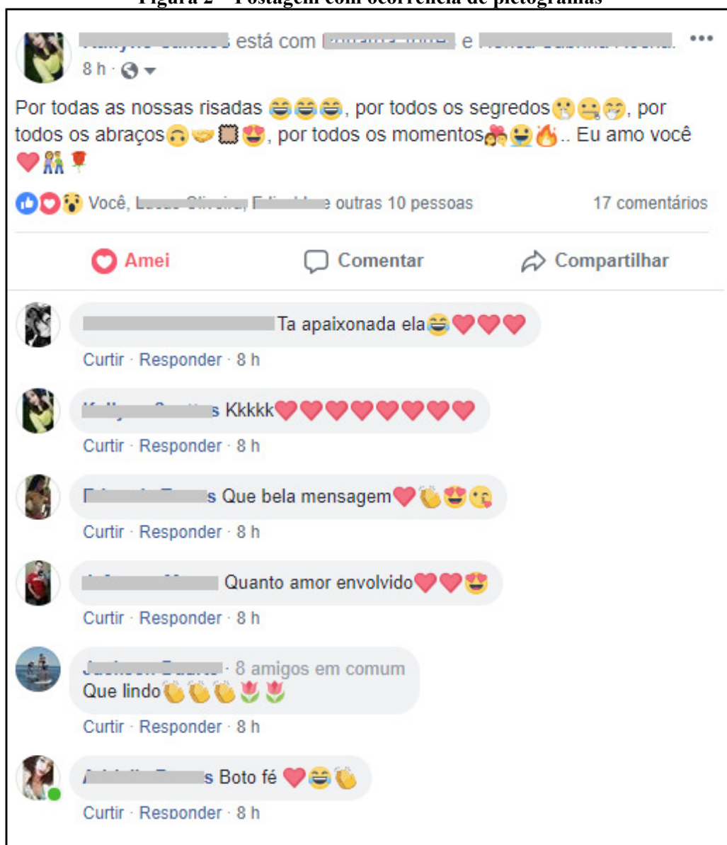
Figura 2 – Postagem com ocorrência de pictogramas

Nesta perspectiva, segundo Gustavo (2016), o Facebook traz inovações de conteúdo e formas de comunicação, numa perspectiva aberta de possibilidades, diferenças e detalhes, ou seja, uma verdadeira “quimera metamórfica” da comunicação, consoante à figura 2, na perspectiva do frequente uso de gifs e emoticons pelo jovem digital, como transmissão de emoções e reações.