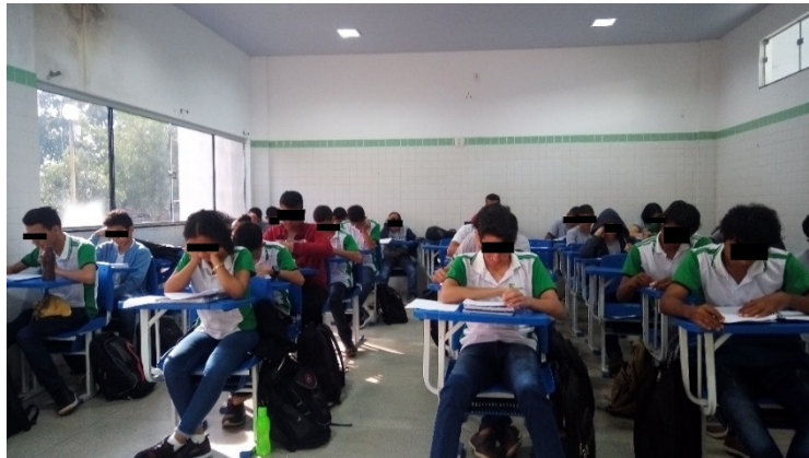
Figura 1: respondendo teste de QI

Na primeira aula os alunos realizaram um teste de Quociente de Inteligência – QI. Os testes de QI, segundo Carvalho (1951, p.1), são importantes para saber o nível mental de uma criança. Assim como assegura Maia (2002, p.261-262), muitos alunos que apresentam dificuldades na aprendizagem podem ser diagnosticados através do uso de teste QI.