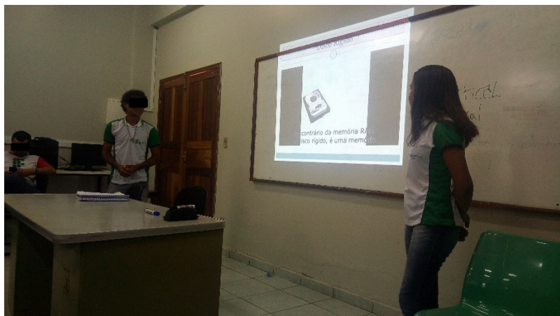
Figura 3: apresentação de trabalho