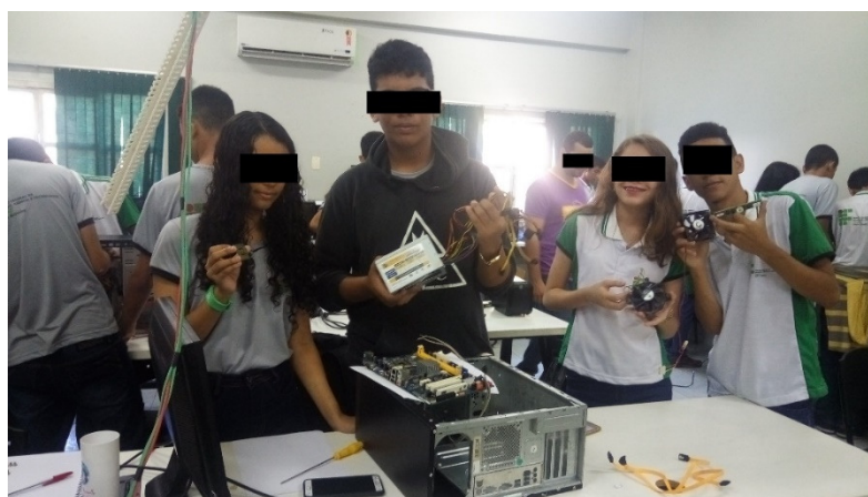
Figura 4: aula prática.

O objetivo da atividade era o reconhecimento do computador em funcionamento, de forma que deveriam desmontar e entregar funcionando, assim como receberam a máquina. Na figura 4 observa-se um dos grupos que exibem as peças do gabinete que eles haviam desmontado.