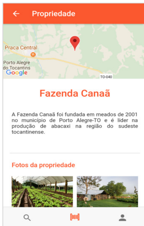
Figura 3 - Tela de exibição dos dados de uma propriedade na aplicação Minha Feira.

Na página de visualização da propriedade (Figura 3), é possível visualizar em um mapa a localização exata da propriedade, uma breve descrição, uma galeria de imagens da propriedade e o nome do responsável pela propriedade. Este recurso acrescenta maior transparência ao processo, permitindo ao consumidor final conhecer de perto a origem do produto adquirido.