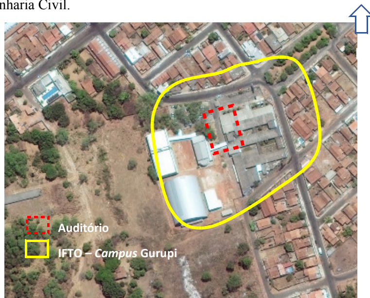
Figura 1- Delimitação da área de estudo – Auditório Professora Maria José Ribeiro de Oliveira IFTO Campus Gurupi

O IFTO- Campus Gurupi, localiza-se no bairro Jardim Sevilha e foi implantado em 2010 com a expansão da Rede Federal de Educação Profissional, Científica e Tecnológica (EPCT). As atividades do Campus iniciaram-se com os cursos técnicos subsequentes em Agronegócio, Edificações e Arte Dramática, e o com um curso superior de Artes Cênicas, o que totalizou em 138 alunos. Atualmente o Instituto possui aproximadamente 700 alunos, divididos nos seguintes cursos: Técnico em Administração Integrado ao Ensino Médio; Técnico Agronegócio Integrado ao Ensino Médio; Técnico em Edificações Integrado ao Ensino Médio; Formação Inicial e Continuada em Operador de Computador, Integrado ao Ensino Médio, modalidade PROEJA; Técnico Subsequente em Edificações; Técnico Subsequente em Agronegócios; Licenciatura em Artes Cênicas; Tecnólogo em Gestão Pública e Bacharelado em Engenharia Civil.