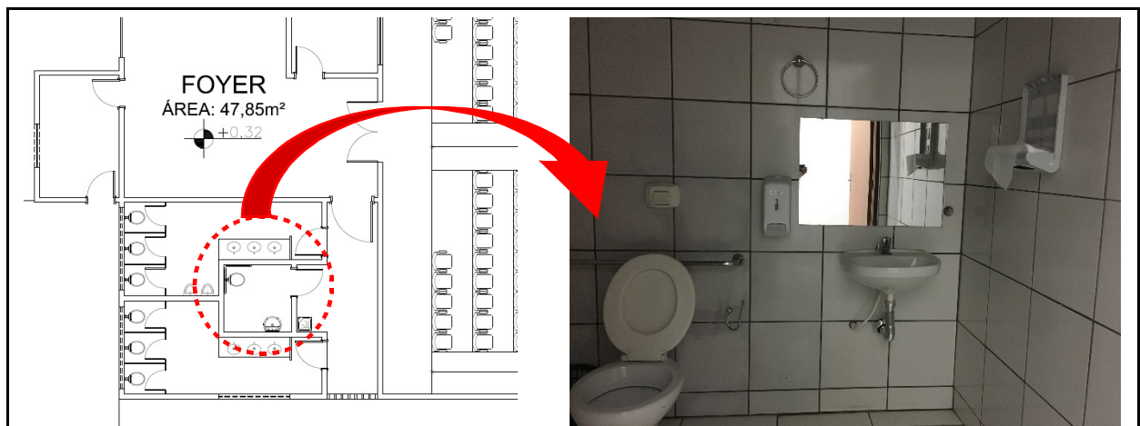
Figura 3 – Banheiro Adaptado para P.C.R.

As dimensões para que o cadeirante consiga circular estão de acordo com a norma, pois foi averiguado nesse estudo as medidas de 1,97m x 1,95m. Os banheiros para P.C.R precisam ser adaptados, e devem representar pelo menos 5% do número total de banheiros . É recomendado, apesar de ser exigência da lei, que se tenha pelo menos um banheiro adaptado às crianças e às pessoas de baixa estatura. Como se trata de um local de evento de médio porte, seria indicado a presença, de mais um banheiro para esse caso, uma vez que o Auditório só comporta um banheiro adaptado.