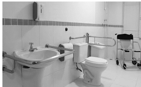
Figura 4 – Projeto de acessibilidade para banheiro.

2.1.6 Órteses e próteses – “Órteses são colocadas junto a um segmento corpo, garantindo-lhe um melhor posicionamento, estabilização e/ou função. São normalmente confeccionadas sob medida e servem no auxílio de mobilidade, de funções manuais (...), correção postural...” (BERSCH, 2017, p. 08);