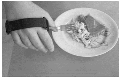
Figura 1 – Fixador de talher para mão.

2.1.2 Comunicação aumentativa e alternativa - Os recursos de comunicação aumentativa e alternativa são destinados para o atendimento de pessoas sem fala ou escrita funcional ou em defasagem entre sua necessidade comunicativa e sua habilidade em falar, escrever e/ou compreender (BERSCH, 2017). Exemplo: