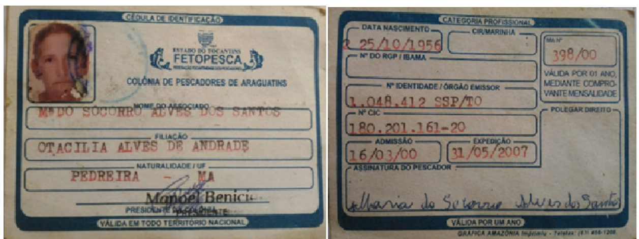
Figura 04 -Cédula de Identificação Pessoal dos associados no ano de 2007, frente e verso.

A figura 04, está representada a cédula de identificação pessoal dos associados emitida no ano de 2007. A idade mínima para se associar na colônia e de 18 anos, em vista que nesta idade o associado apresentará todas as condições para exercer a atividade pesqueira.