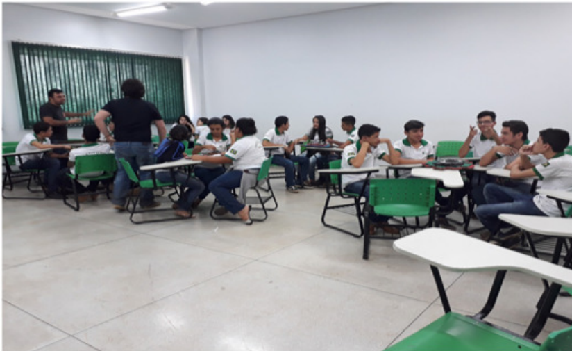
Figura 3. Participação e integração dos alunos na apresentação de dados analíticos referente ao local citado na figura