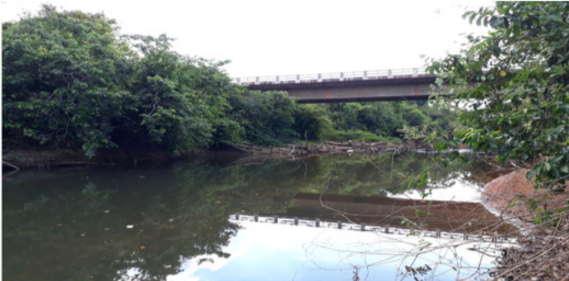
Figura 2. Área de atuação rio Cunchãs.

de avaliar as questões de entendimento da dinâmica ambiental, local e regional. Dessa forma, a região que foi utilizada para as aulas de campo, sendo aulas práticas para os alunos está inserida em quatro unidades geomorfológicas conforme o SEPLAN (2012), apresentando diversas características distintas, sendo Depressão do Médio Tocantins; Planalto do Interflúvio Tocantins – Araguaia; Patamares do Araguaia e Depressão do Médio e Baixo Araguaia.